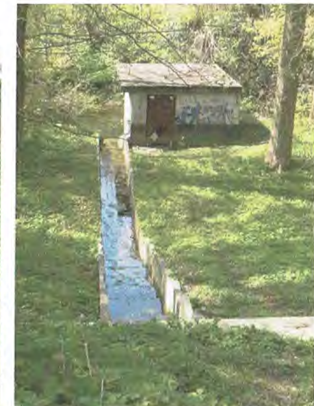
WKA und Entlastungsrinne