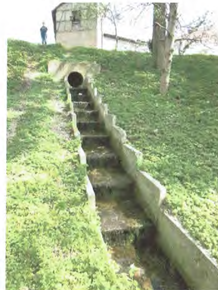
Blick von WKA zu Gebäude am Einlauf, Entlastungsrinne